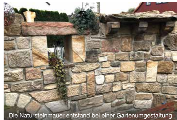
Die Natursteinmauer entstand bei einer Gartenumgestaltung