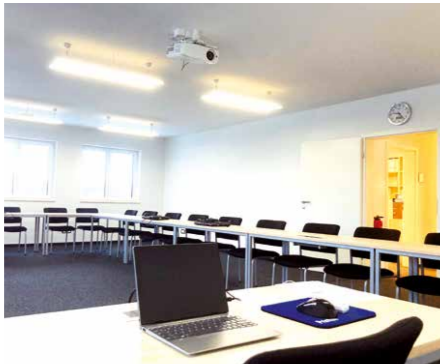
Modern ausgestatteter Konferenzraum im neuen Anbau

„Noch gibt es viele Fragen zu beantworten und Probleme zu lösen, bevor auch dieser digitale Prozess rund ist und den betrieblichen Alltag so abbildet, dass er die Arbeit erleichtert, vereinfacht und effizienter macht. Denn darum geht es schlussendlich.“