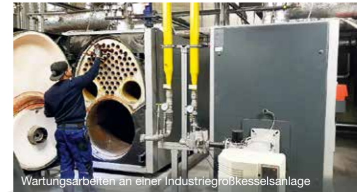
Wartungsarbeiten an einer Industriegroßkesselanlage